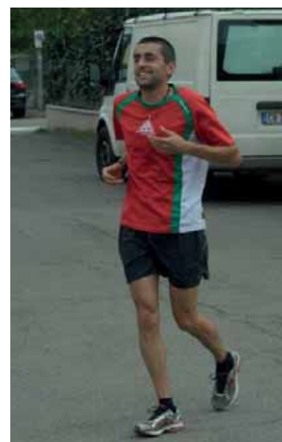
Vincitore gara podistica 2014