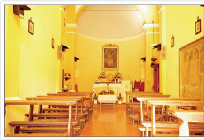
oratorio di Garofalo

attività pastorali, ma a Formica ci auguriamo che possa avere inizio la costituzione della terza squadra di calcio che, senza obiettivi agonistici o di selezione dei giocatori, si pone l'obiettivo di favorire l'aggregazione e l'integrazione dei ragazzi che compongono le squadre e le loro famiglie.